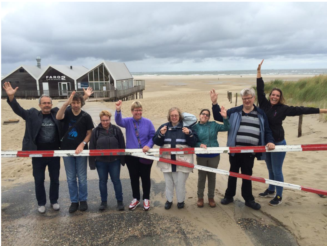
Nog even een fotomomentje! Op naar de zeehonden!